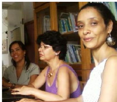
Parte da equipe do projeto em momentos distintos

Objetivo específico 1: Dar suporte profissional de comunicação social ao subcomitê: hospedagem, administração e produção de conteúdo do site, boletim eletrônico, assessoria de imprensa.