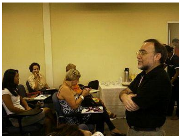
Reunião: Câmara Técnica do Subcomitê Pinheiros-Pirapora

As atividades desenvolvidas no período foram: Assessoria de Imprensa (AI); participação e cobertura de eventos; produção e edição de fotos; produção, edição e revisão de conteúdo; pesquisa; alimentação de seções do site (agenda, fotos, notícias, links, etc.); produção e envio de boletim; indicadores (número de acessos, quantidade de conteúdo inserido – agenda, links, notas, feedback, participação em eventos); clipagem, entrevistas; levantamento para o Guia de Mídias; elaboração, edição e revisão de relatório. Abaixo a descrição da rotina de trabalho detalhando as atividades desenvolvidas, conforme objetivos específicos e metas do projeto.