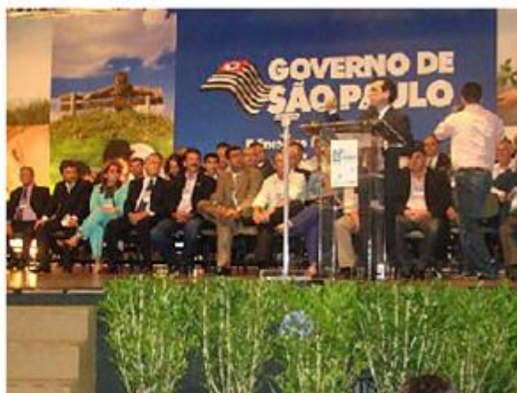
Premiação Projeto Verde Azul 2009. O evento, realizado em 01/12/09, contou com a presença de representantes da câmara técnica de planejamento do subcomitê Pinheiros-Pirapora