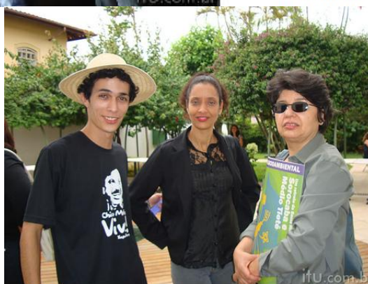
29/10/2009: Participação no Lançamento do Atlas Socioambiental: um retrato da Bacia Hidrográfica dos Rios Sorocaba e Médio Tietê, Itu (SP).