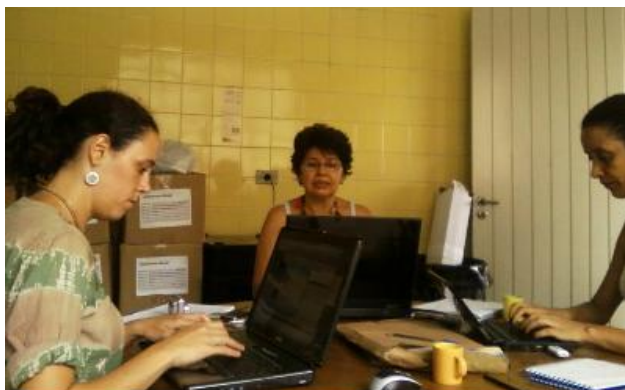
Parte da equipe trabalhando na sede do Instituto 5 Elementos

As tarefas programadas e executadas para o mês de fevereiro são: Assessoria de Imprensa (AI); participação e cobertura de eventos; produção e edição de fotos; produção, edição e revisão de conteúdo; pesquisa; alimentação de seções do site (agenda, fotos, notícias, multimídia, links, etc.); produção e envio de boletim; indicadores (número de acessos, quantidade de conteúdo inserido – agenda, links, notas, feedback, participação em eventos); levantamento de informações para o Guia de Mídia; entrevistas para a vaga de estagiário de ciências sociais; clipagem e arquivamento, edição e revisão de relatório. Abaixo a descrição da rotina de trabalho detalhando as atividades desenvolvidas, conforme objetivos específicos e metas do projeto.