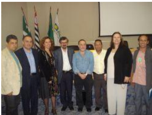
Subcomitê elege gestão 2009-2011