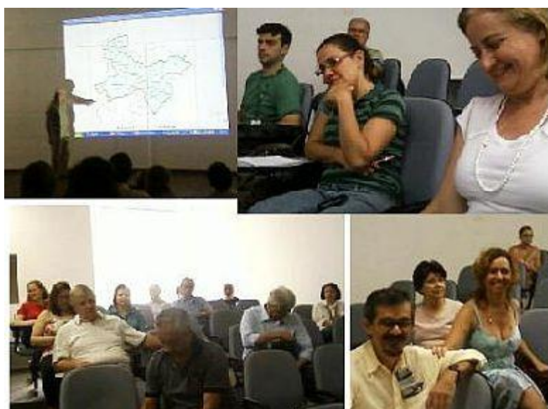
Plenária realizada em 11/12/2009

Meta: Administrar e produzir conteúdo jornalístico para o site www.pinheirospirapora.org.br