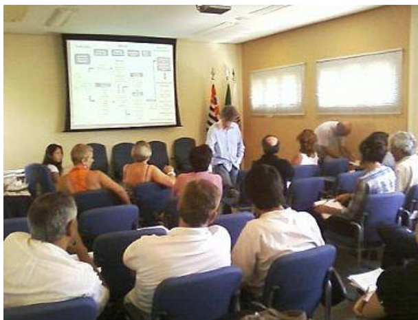
Reunião 13/11/2009, realizada no CIESP Diretoria Distrital Oeste, Lapa (SP)