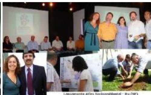
Participação em evento (2009)